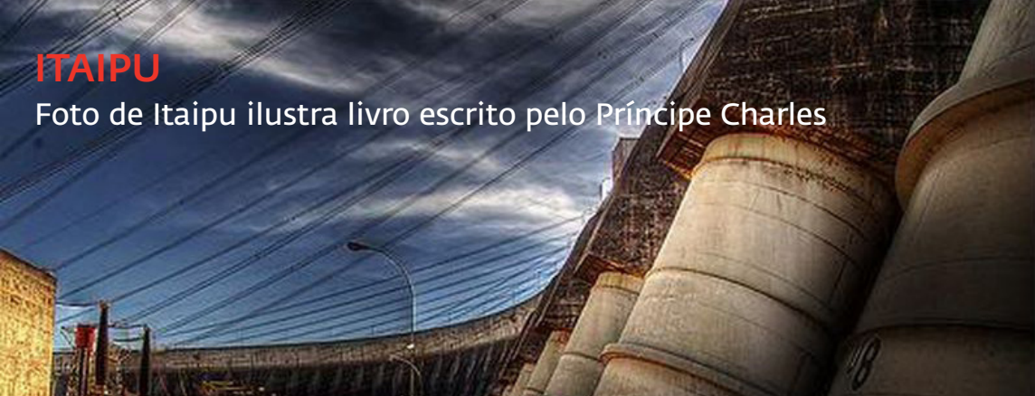
Foto de Itaipu ilustra livro escrito pelo Príncipe Charles

O livro "Harmony - A revolução da Sustentabilidade", escrito pelo Príncipe Charles - herdeiro da coroa britânica -, tem na página 77 uma foto da Itaipu Binacional, apresentada como "a maior usina geradora de energia da Terra".